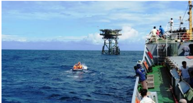
Tàu Hải quân đem quà xuân ra Nhà giàn DK1/11

“Một ba lô cây súng trên vai. Người chiến sỹ quen với gian lao”. Hành trang của người lính muôn đời vẫn là một tay súng, một chiếc ba lô, nhưng sự hy sinh và nỗ lực nhàn mà các anh đã trải qua thật khó nói hết bằng lời. Chiến tranh đi qua, cuộc sống của người lính biển đảo vẫn không một phút bình yên. Bởi ở nơi xa tiền tiêu Tổ quốc ấy, các anh đứng gác trong gió gào sương lạnh, làm nhiệm vụ thiêng liêng cao cả của mình để bảo vệ vùng trời vùng biển cho Tổ quốc.