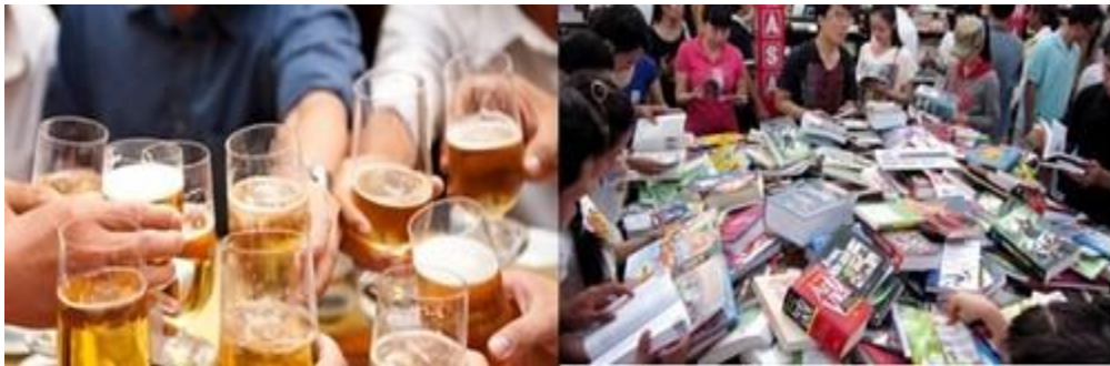
“Nhậu” nhiều, đọc ít và sự lên ngôi của văn hóa rẻ tiền

Người Việt chi ra 3 tỷ đô la để tiêu thụ 3 tỷ lít bia mỗi năm, nếu chia đều trên bình quân dân số mỗi người từ mới lọt lòng đến gần về thiên cổ sẽ “gánh” hơn 33 lít!. Một con số kinh hoàng, không sai nếu xếp bia rượu vào quốc nạn, nhớ ngày xưa Bác Hồ nói thực dân Pháp đầu độc dân tộc ta bằng rượu cồn... thì nay chúng ta đã tự mua cò đầu độc chính mình.