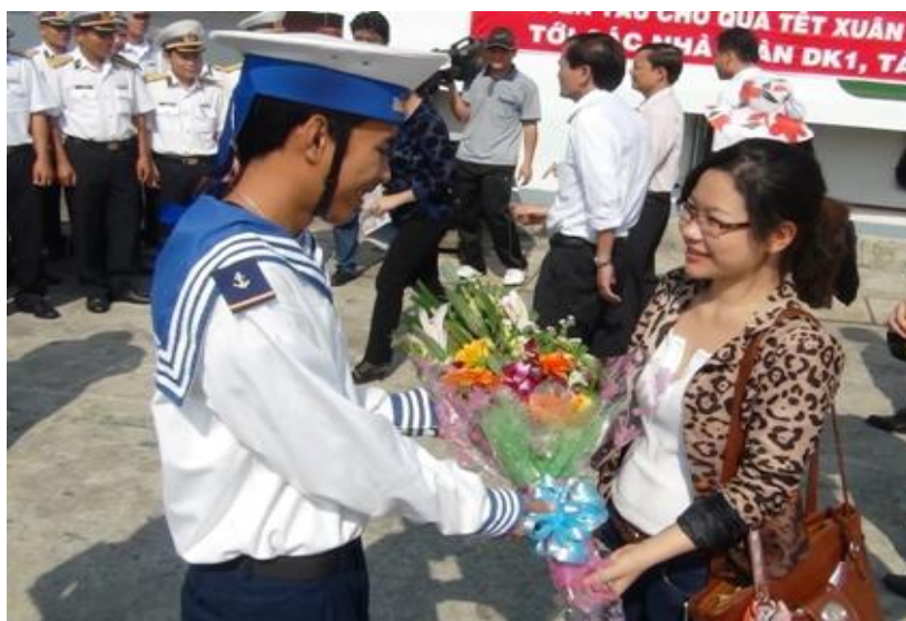
Niềm vui của chiến sĩ khi được khách đất liền ra thăm, chúc Tết

Còn bao chàng trai trẻ trong phút nhớ nhà, chỉ biết tâm sự với chính mình hay với sóng biển. Thế mới hiểu các anh trông đợi tin tức từ đất liền biết nhường nào. Nhiều khi cả hơn hai tháng mới có tàu thay trực. Nhận được thư người thân, lính đảo cứ truyền tay nhau đọc mà san sẻ niềm vui. Mỗi khi có đoàn ra giao lưu, các anh đều đón tiếp nồng nhiệt chân thành, để rồi bịn rịn lúc chia tay. Thời gian gặp nhau tuy ngắn ngủi, nhưng những lá thư xanh, dòng địa chỉ trao tay đã bù đắp phần nào nỗi cô đơn trong lòng họ.