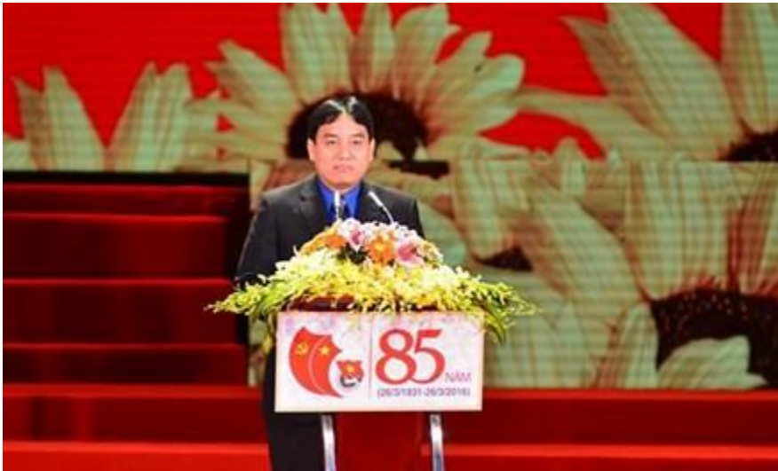
Đồng chí Nguyễn Đắc Vinh, Ủy viên BCH T.Ư Đảng, Bí thư thứ nhất T.Ư Đoàn phát biểu khai mạc buổi lễ

Ngay từ những ngày đầu thành lập Đảng, đấu tranh giành chính quyền, Bác Hồ và Đảng ta đã coi trọng việc xây dựng tổ chức Đoàn thanh niên để tập hợp, đoàn kết thanh niên phấn đấu vì mục tiêu lý tưởng của Đảng và dân tộc.